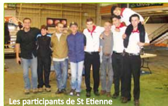
Les participants de St Etienne